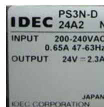
変更後の定格ラベル