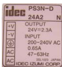
変更前の定格ラベル