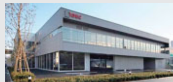
IDEC SALES OFFICE